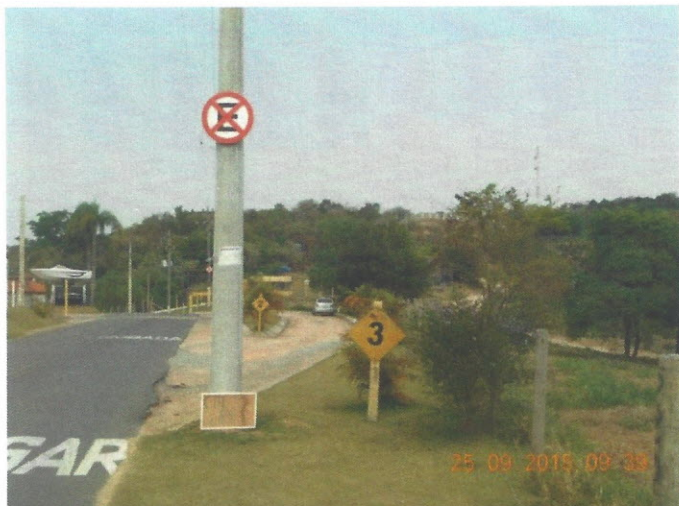
Ponto 06: E – 0254799/ N – 7386072