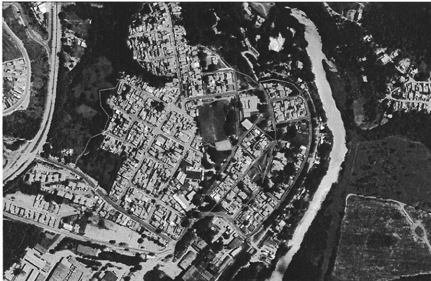
Figura 1. Redes de esgotamento sanitário implantada pela Concessionária (cor azul) nos bairros Votocel e Vila Amorim, bem como locais onde serão executadas novas redes (cor vermelho)

Ainda, abaixo colacionamos a Tabela 1 com os quantitativos (metragem) de redes de esgotamento sanitário já executadas nos bairros Votocel e Vila Amorim, bem como as que ainda serão executadas.