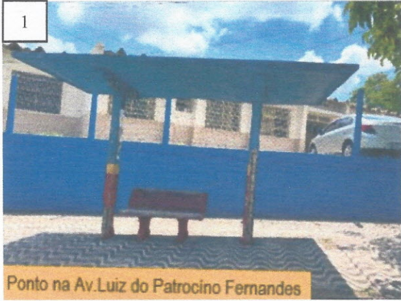
Ponto na Av. Luiz do Patrocino Fernandes