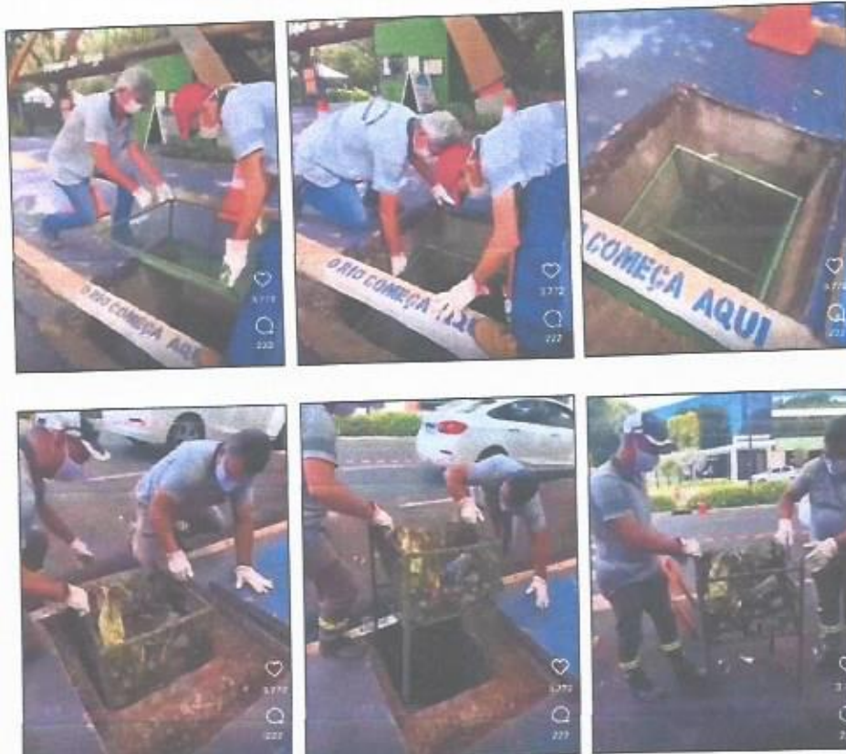
Município de Maringá