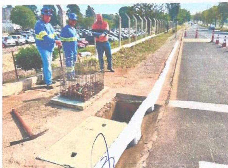
Município de Sorocaba